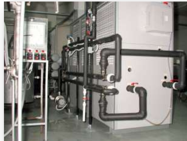
Получение ледяной воды. Московский молокозавод.