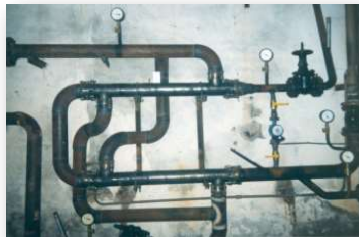
Приготовление ГВС в жилом доме