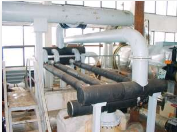
Отопление и горячее водоснабжение. ТЭЦ АвтоВАЗ, г.Тольятти.