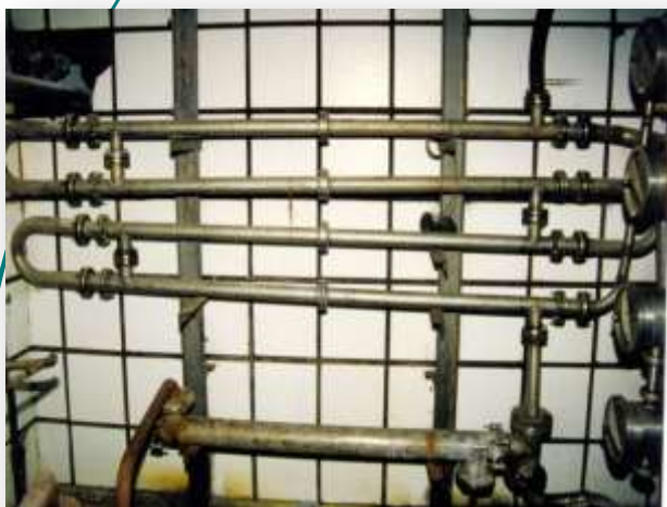
Тепловая обработка вина. Севастопольский винзавод